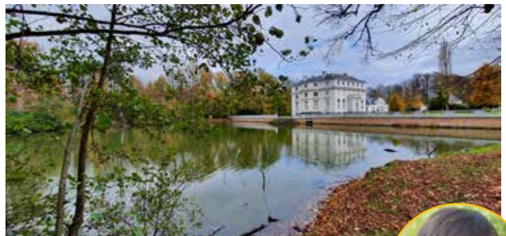
▲ De vijver in het kasteeldomein Hof ter Linden.

Vlaams minister van Omgeving Zuhair Demir zet sterk in op de strijd tegen waterschaarste. Ze vraagt aan de lokale besturen om het goede voorbeeld te geven. In Edegem doen we dat met de opmaak van een hemelwaterplan. Aan de hand van een grondige studie van de problemen, noden en opportuniteiten ontwikkelen we een visie die ons beleid zal sturen op het vlak van infiltratie, hemelwateropvang, omgaan met verharding en buffering van water in wadi's en open grachten.