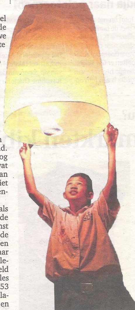
Op het strand gingen lampionnetjes de lucht in.